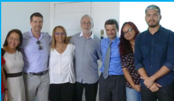
Tijdens bezoek aan Ceifar (3 de van R)